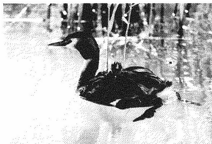
Fuut met jong, gefotografeerd door Bert Roelofs

De jongen hebben een zwart wit gestreept boevenpakje aan. Koddig is het altijd weer om een fuut langs te zien zwemmen en dan ineens een klein kopje onder de veren te zien uitsteken, en dan nog een, en plotseling weer een. Als de kleintjes wat groter worden zie je zo'n oudervogel soms als een kiepauto omhoog uit het water komen en tuimelen de jongen pardoos in het water, vaak naarstig proberend weer op de rug omhoog te klauteren. Dat lukt ze alleen maar als de ouder het ook toestaat. Ongelooflijk ook om te zien hoe die kleintjes in staat zijn flinke vissen naar binnen te werken en er niet voor terugdeinzen voor te kruipen en te proberen een visje van de ander af te pakken.