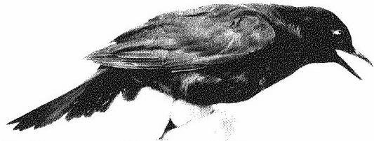
Merel man, mogelijk een noordelijke vorm

5477205 Geringd als nestjong in Landsmeer op 07.06.2014. Als raamslachtoffer gemeld op 11.11.2014 in Muiderberg.