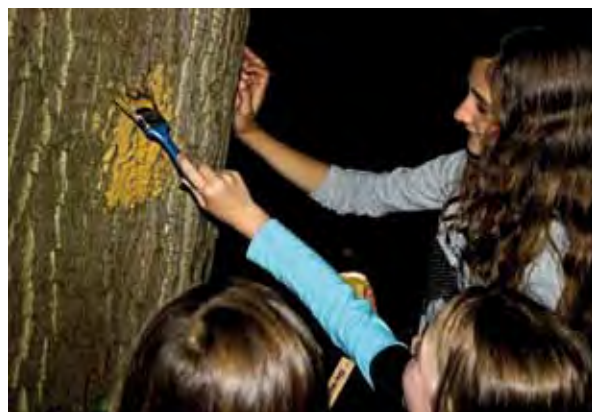
Stroop smeren een leuke klus.

In het kader van de actie 'nachtvlinders in de schijnwerper' hebben we een zoekkaart gemaakt van tien redelijk veel voorkomende voorjaarsuilen. Deze is, samen met dit nummer van Vlinders, verspreid en hierop kun je zien wat de belangrijkste verschillen zijn. Ook kun je natuurlijk altijd op www.vlindernet.nl kijken voor nog meer foto's en herkenningstips. We hopen dat veel mensen op zoek gaan naar voorjaarsuilen en ook dat de waarnemingen worden doorgegeven via www.waarneming.nl of www.telme.nl . We zijn benieuwd!