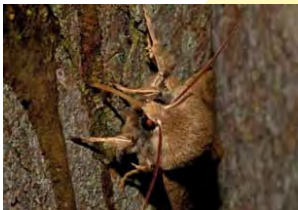
Een dubbelstipvoorjaarsuil snoept van de stroop.

Er zijn vele tientallen strooprecepten in omloop. Bijna iedere nachtvlinderaar heeft zijn eigen favoriete recept. De belangrijkste ingrediënten zijn altijd: stroop,