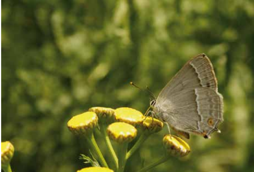
Eikenpage, op boerenwormkruid. Foto boven: pad in sectie 8 van de route.

zijdige' waarnemingen. Aan de boskant van het traject vliegen zelden vlinders.