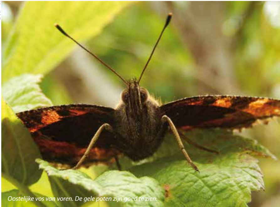
Oostelijke vos van voren. De gele poten zijn goed te zien.