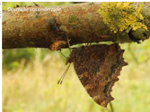
Oostelijke vos onderzijde.