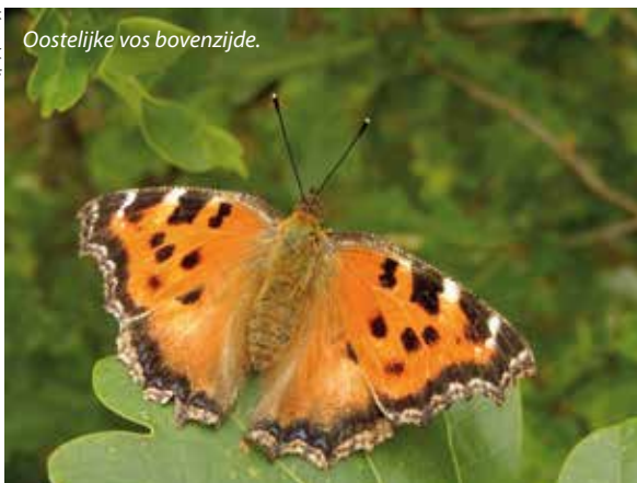
Oostelijke vos bovenzijde.