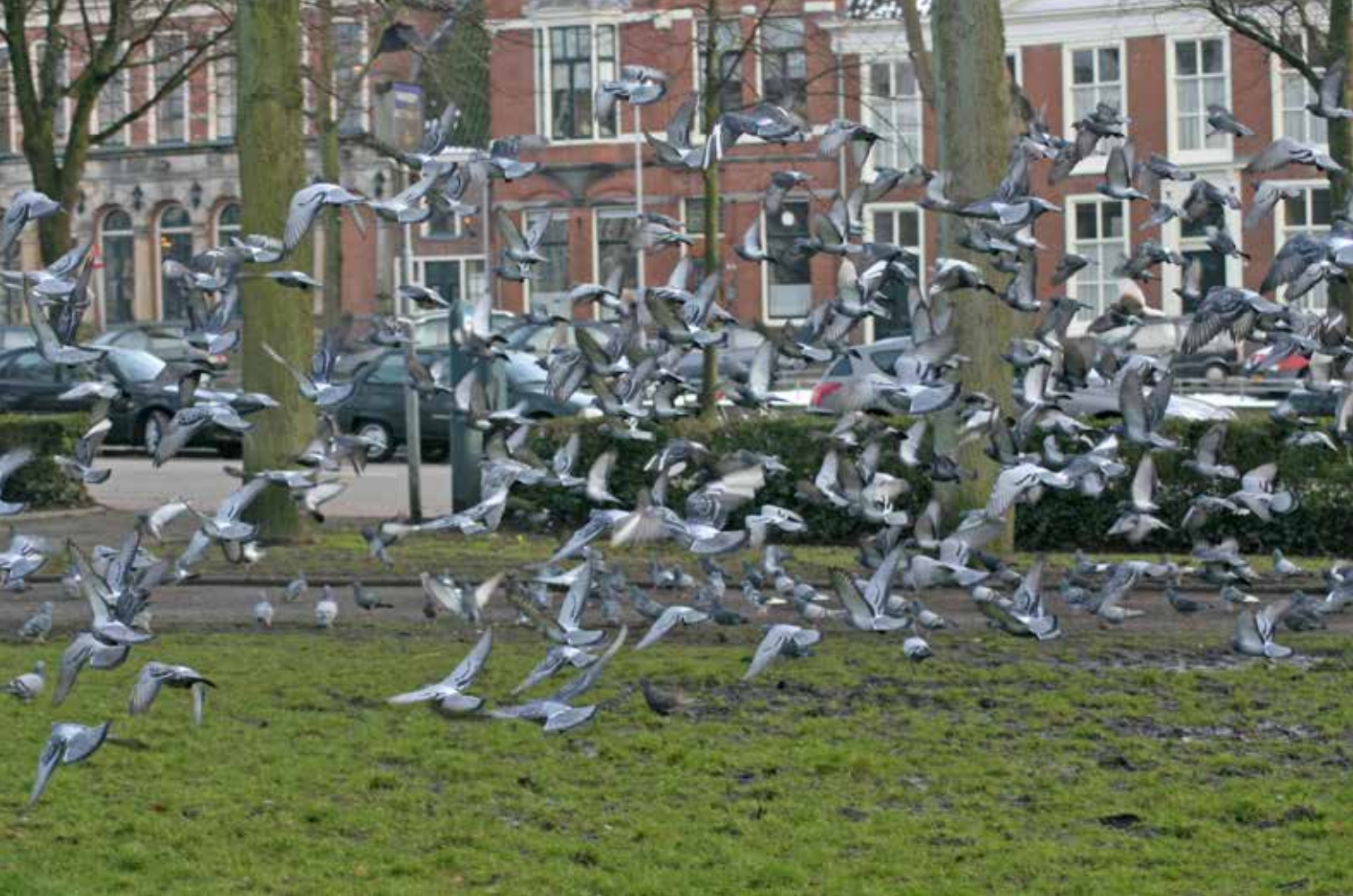
Groep van minimaal 150 Stadsduiven op het Guyotplein in de stad Groningen, 3 maart 2006