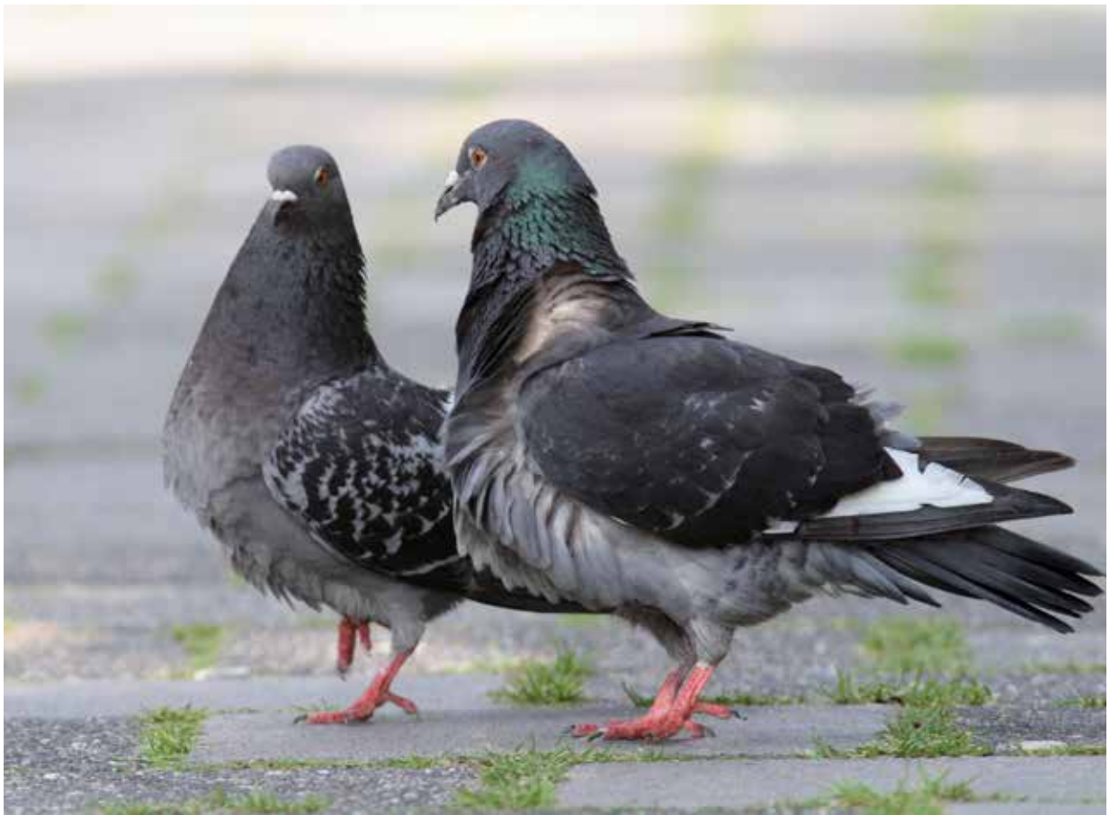
Stadsduiven in het Noorderplantsoen in de stad Groningen, 5 juli 2007