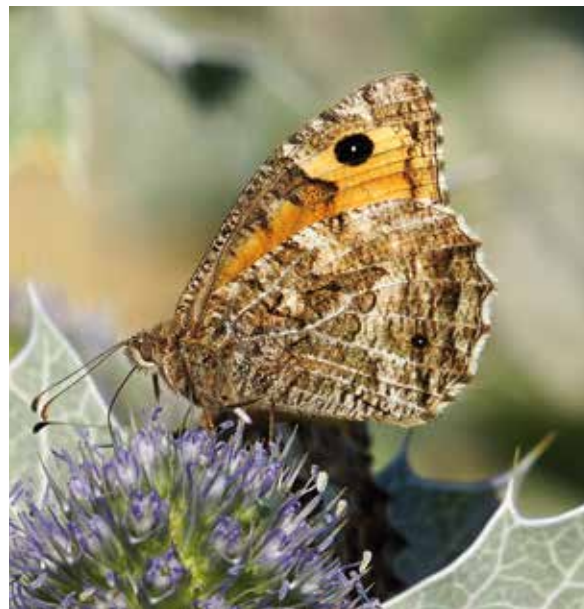
Heivlinder op blauwe zeedistel.

op 100% gesteld is. Met andere woorden: als we op Texel, ondanks de afname van de index, nog steeds behoorlijke aantallen heivlinders zien betekent dat dat de aantallen ruim twintig jaar geleden nog véél hoger waren.