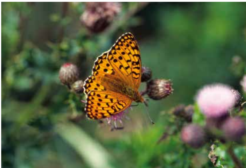
De duinparelmoervlinder kruipt langzaam uit het dal.

Op grond van jarenlange tellingen blijkt het mogelijk de aan het begin van dit artikel gestelde vraag of Texel voor de genoemde 'zorgenkindjes' nu wel of