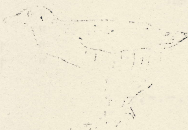
1. W. K. T. L. O. N. I. N. G.

De genoemde aantallen rallen moeten niet als definitief worden beschouwd maar zijn veeleer bedoeld als indicatie van het belang van de Dollard voor rallen. Dit verslag is dan ook bedoeld als aansporing om 's nachts te gaan vogelen.