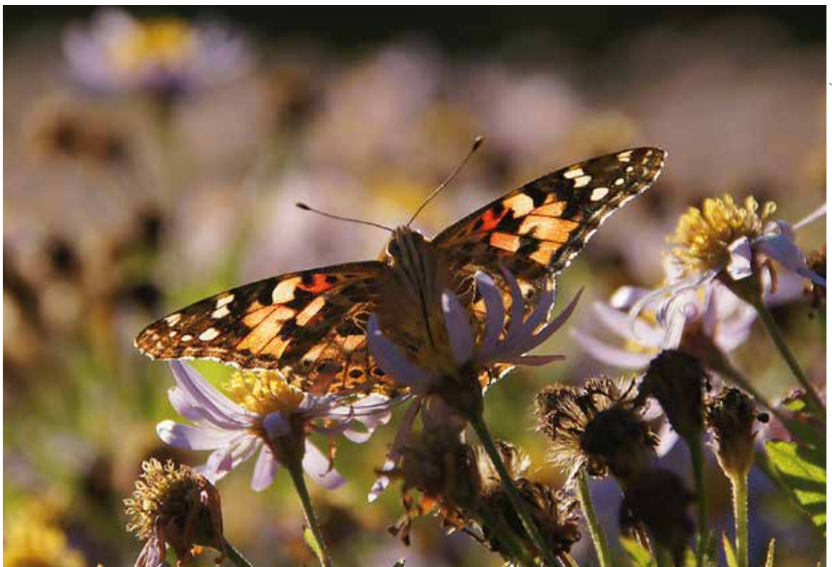
Distelvlinder: Afrikaanse migrant.