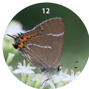
De negen soorten met een matige tot sterke toename: (4) grote parelmoervliender, (5) veldparelmoervliender, (6) kleine heivliender, (7) spiegeldikkopje, (8) bruin dikkopje, (9) donker pimpernelblauwtje, (10) veenbesparelmoervliender, (11) pimpernelblauwtje en (12) iepenpage.