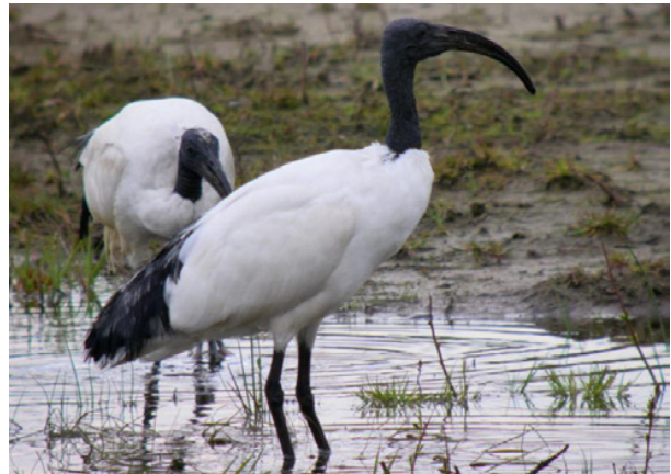
Heilige ibis

Meldingen uit meerdere km-hokken kunnen betrekking hebben op hetzelfde rondzwervende individu. (Bron: waarneming.nl)