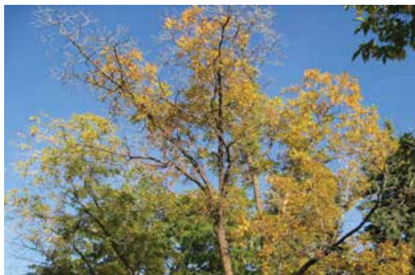
Aangetaste walnoot.

De Nederlandse Mycologische Vereniging is gevraagd op te letten op het voorkomen van deze tot op heden nog niet in Nederland aangetroffen ziekte. Verdachte bomen kunnen via exoten@mycologen.nl gemeld worden. Deze meldingen zullen worden doorgegeven aan het Team Invasieve Exoten.