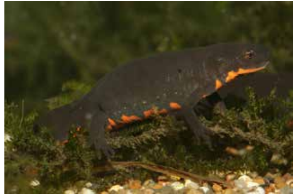
Soorten als de Chinese vuurbuksalamander ( Cynops orientalis ) worden in grote aantallen wereldwijd verhandeld in de terrariumhandel.

Frank Pasmans: “Gezien het maatschappelijk belang van het behoud van Europese biodiversiteit, die door deze schimmel bedreigd wordt, is het zeer dringend dat overheden middelen vrijmaken om dit probleem snel en adequaat aan te pakken.”