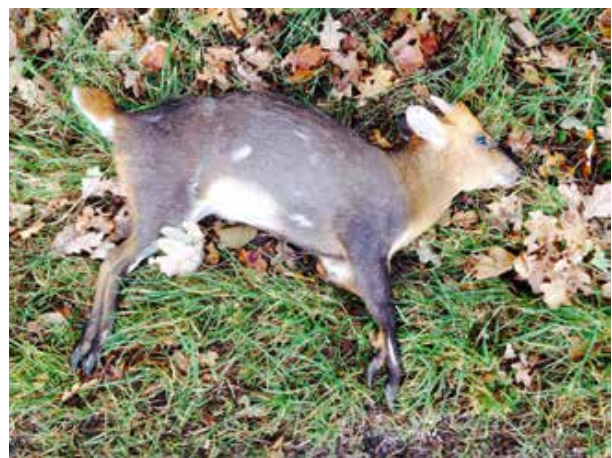
Verkeersslachtoffer muntjak Landgoed Baest.

Naar verwachting treedt op 1 januari 2015 de Positieflijst in werking, waarmee het houden van exotische zoogdieren voor een belangrijk deel wordt ingeperkt. De lijst is nog niet definitief; de muntjak zal er niet op komen vanwege het bezits- en handelsverbod. Het sikahert zal er naar verwachting wel opkomen, als te houden diersoort onder voorwaarden.