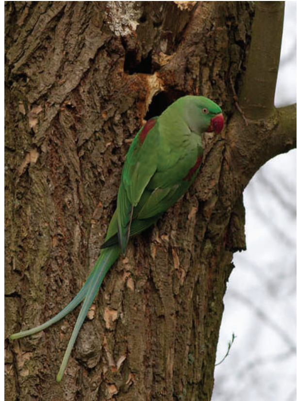
Grote alexanderparkietvrouw bij nestholte, Sloterpark Amsterdam, 23 maart 2014.

Daarnaast komen uitheemse populaties van de soort voor in diverse landen in het Midden-Oosten en is de soort waargenomen in Noord-Amerika en in diverse Europese landen. Vermoedelijk betreffen dit (nazaten van) uit gevangenschap ontsnapte/vrijgelaten vogels. Daar lijkt het huidige leefgebied overeen te komen met dat van de halsbandparkiet: stedelijke agglomeraties met bosjes en parken. Ook qua ecologie vertoont de grote alexanderparkiet veel overeenkomsten met de halsbandparkiet. Zo leeft de soort ook van zaden, bloemen, (nectar), jonge scheuten, knoppen en vruchten en ook wintervoer. De soort is holenbroeder. In zacht hout-boomsoorten (palmen) kan de soort zelf gaten maken. Hij lijkt in Nederland vooral bestaande boomholten te bezetten (zoals inrottingsgaten) en kan die eventueel zelf vergroten.