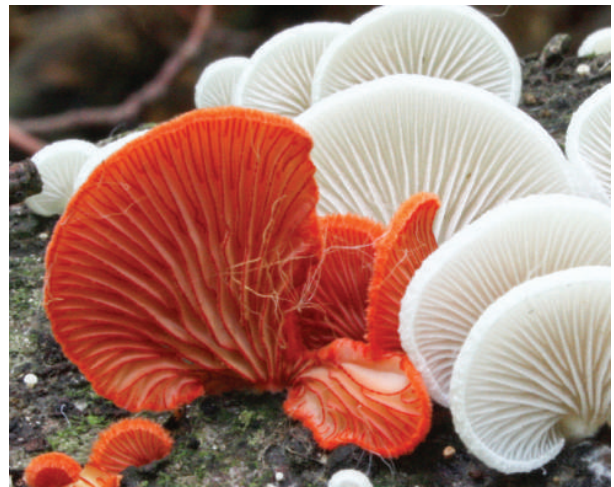
Rood oorzwammetje, Flevoland 2014

Reden genoeg om in een wat groter gebied van Europa te kijken naar het voorkomen van het rood oorzwammetje. Uit de opgespoorde gegevens blijkt dat het aantal vindplaatsen in Noordwest-Europa sinds 1990 sterk is vooruitgegaan. Vooral in Groot-Brittannië, waar de soort in 1995 pas voor het eerst gevonden werd, is dit het geval. Het rood oorzwammetje is sinds 2000 voor het eerst ook in België, Duitsland en Nederland gevonden. Bij het nakijken van vondsten is te zien dat, nadat de soort opduikt, deze vaak verschillende jaren op dezelfde vindplaatsen te zien blijft, terwijl nieuwe vindplaatsen regelmatig in de buurt gevonden worden. Het rood oorzwammetje wordt opvallend veel gezien tussen groepen van andere soorten oorzwammetjes. Of dit betekent dat ze de andere soorten verdringt, of er wellicht op parasiteert is door gebrek aan onderzoek niet duidelijk.