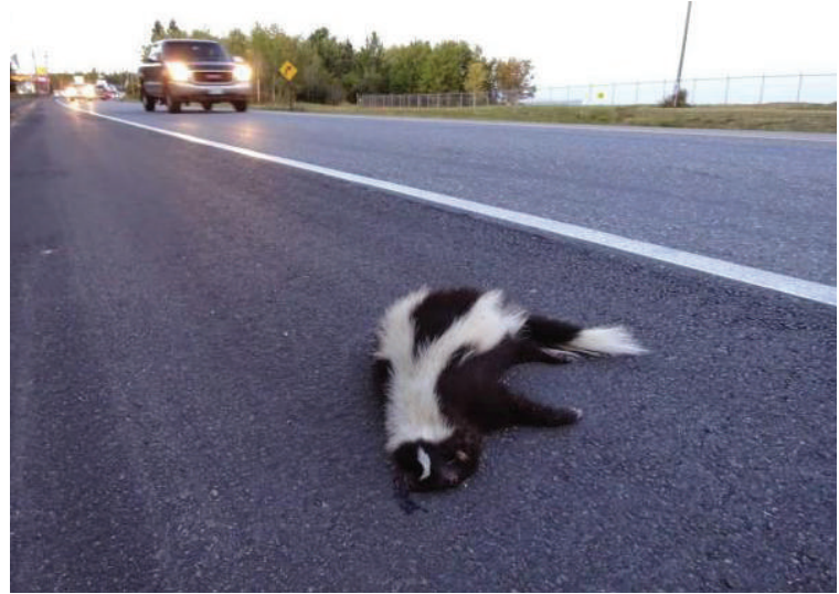
Stinkdieren worden vaak slachtoffer van het wegverkeer. Hier een aangereeden exemplaar in de VS.

In 2005 werd in Midden-Limburg voor het eerst een doodgereden gestreept stinkdier gevonden. In 2003 ontsnapten in Haule tien dieren bij een plaatselijke dierenhandelaar. Vanaf 2007 t/m 2011 zijn regelmatig (levende en dode) stinkdieren gemeld in Zuidoost-Friesland (figuur 1), nabij het Fochteloërveen (tussen Drachten en Assen). Een aantal dieren vestigde zich in het Blauwe Bos. Ook werden dieren gezien in het Tonckensbos en op de Duurswouder Heide. In 2005 werden in het Blauwe Bos onvolwassen dieren gezien, wat duidde op voortplanting in het wild. Onduidelijk is hoe groot de