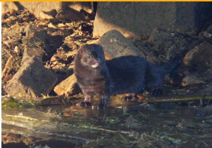
Amerikaanse nerts.

Europese lijst: voor deze soort wordt een EU-ricisobeoordeling opgesteld. Dit zou uiteindelijk kunnen leiden tot opname op de Unielijst van EU-verordening 1143/2014.