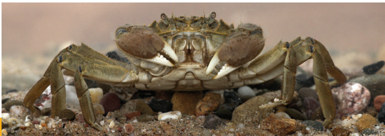
Chinese wolhandkrab.

Soes, D.M., P.W. van Horssen, S. Bouma & M.T. Collembon, 2007. Chinese wolhandkrab. Een literatuurstudie naar ecologie en effecten. Rapportnummer 07-234. Bureau Waardenburg B.V., Culemborg. http://edepot.wur.nl/117478