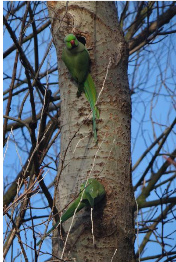
Halsbandparkieten inspecteren nestgaten.

Buiten deze broedverspreiding die zo'n 134 atlas-blokken (5x5 km) beslaat volgens www.vogelatlas.nl , is de soort op Waarneming.nl in 2016-2017 uit nog eens 132 atlasblokken