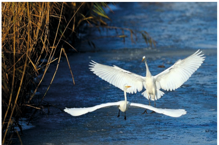
Grote Zilverreigers.

Dit jaar hadden elf fotografen foto's ingezonden. In totaal 47 foto's. Een fotograaf mag slechts met één foto in de finaleronde zitten. Er moest dus af en toe opnieuw gestemd worden, doordat meerdere juryleden gelijk gestemd hadden. Soms wel drie keer omdat de stemmen gelijk bleven. Dat ging in alle gemoedelijkheid.