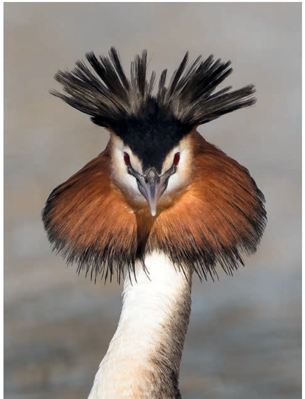
De Eerste prijs was voor deze foto van een Fuut.