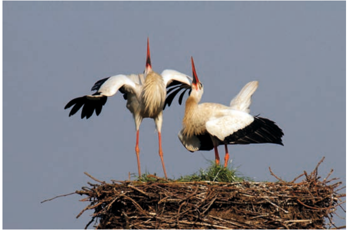
Ooievaars landend op nest.