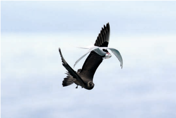
Noordse Stern met prooi, achtervolgt door een Kleine Jager.

Bijeneters (Otto Plantema) en een Bosruiter (Ronald Huijssen). Op plaats zes: twee Ooievaars landend op een nest (Hans de Braal) en op plaats vijf: een Noordse Stern, achtervolgd door een Kleine Jager (Jelle de Jong).