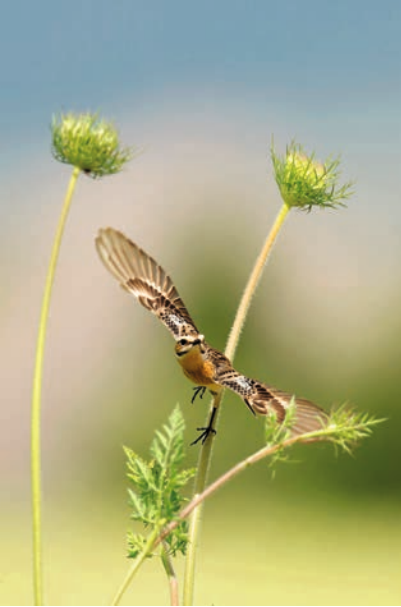
Tweede prijs: Zwartkop. Foto: Wiel Arets.