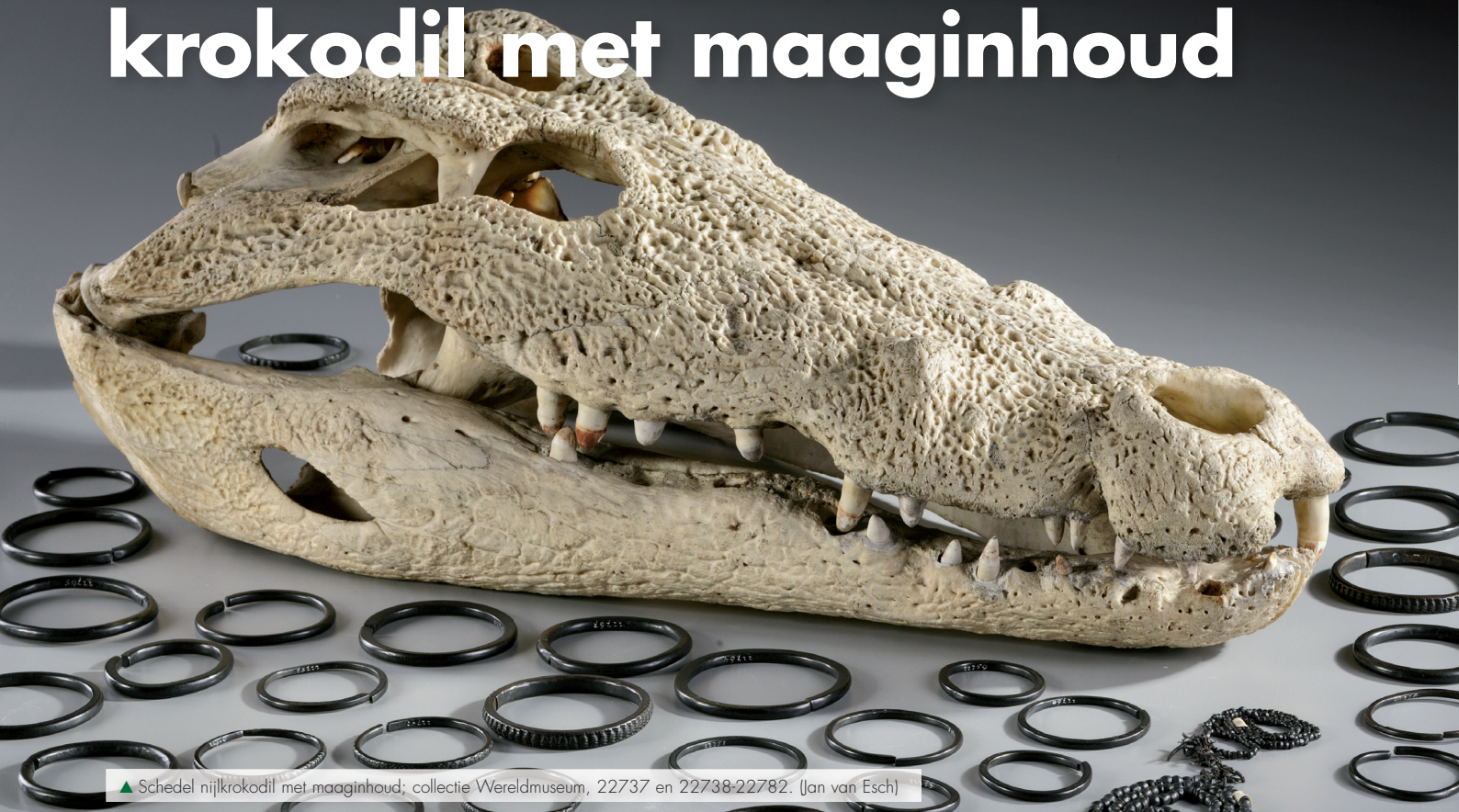
▲ Schedel nijlkrokodil met maaginhoud; collectie Wereldmuseum, 22737 en 22738-22782.