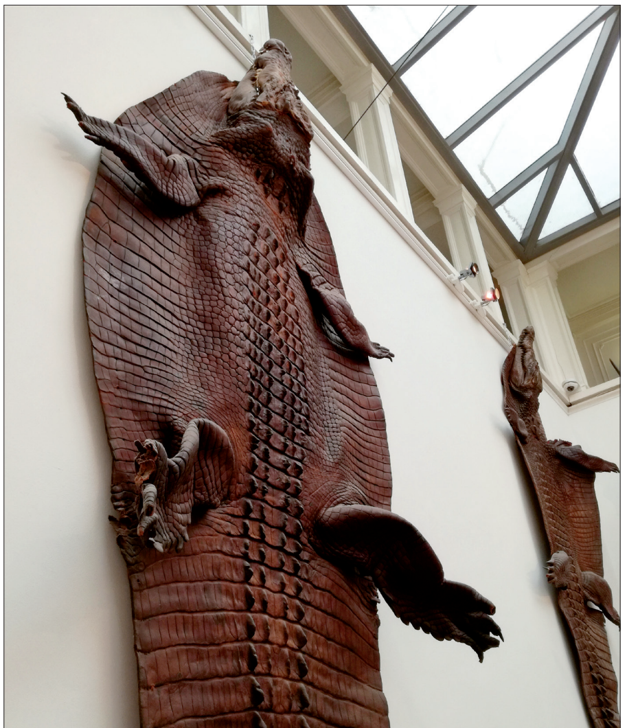
▲ De blikvangers van het trappenhuis in Het Natuurhistorisch: de huiden van twee zeekrokodillen. (Bram Langeveld)

Zeker is dat niet, want misschien zijn de kleinste polsbandjes wel oorbellen. Niettemin vormt de schedel van de krokodil in combinatie met de sieraden een passende en verrassende tijdelijke aanvulling op de groeiende verzameling dode dieren met een verhaal. ◀