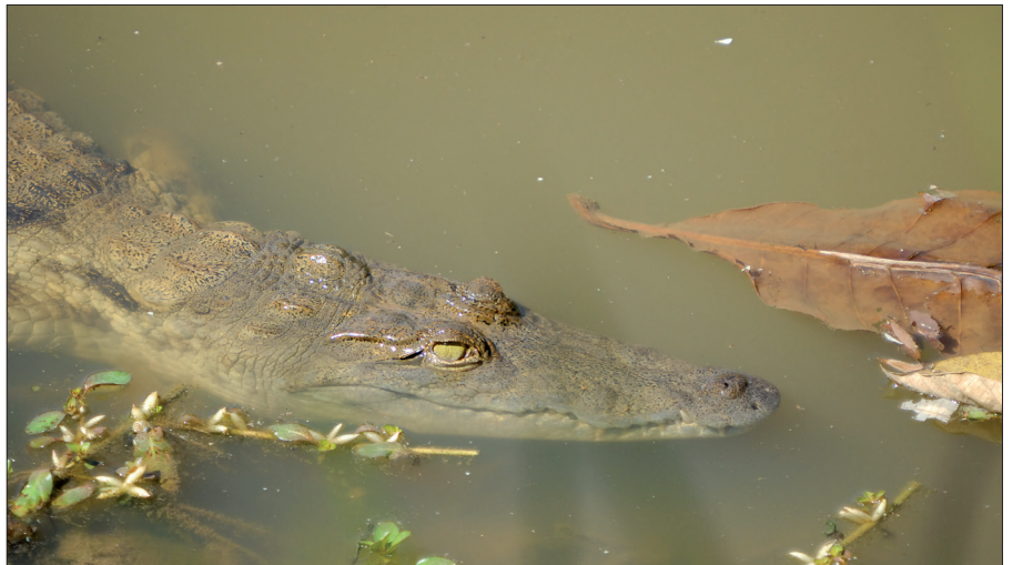
▲ Een onvolwassen nijlkrokodil in Abuko National Park, Gambia. (André de Baerdemaeker)

André de Baerdemaeker die in 2013 een maand in het grensgebied van Malawi en Mozambique, grofweg 130 kilometer van Mopeia, verbleef, praatte mij bij over de krokodillen en hun relatie met de mens. Daar, in het stroomgebied van de Shire, die uitmondt in de Zambezi, bezocht hij verschillende vissersdorpen. Aan de oevers van de rivier en de omringende moerassen, waar het wemelde van de nijlkrokodillen, stonden iedere dag vrouwen de was te doen met hun kinderen naast zich of met een doek op hun rug gebonden, voorovergebogen in kniediep water. Op de vraag of men zich geen zorgen maakte vanwege krokodillen en - de minstens zo gevaarlijke - nijlpaarden was het antwoord overal hetzelfde: "Mijn tijd komt als God het wil." Deze levenshouding valt misschien te prijzen, maar hindert de lokale autoriteiten in hun educatieve inspanningen tot preventie van krokodillenaanvallen. Verder kreeg André te horen dat in ieder dorp wel enkele verliezen te betreuren waren. In sommige gebieden wel een of twee per jaar. Daarmee lijkt het aanemelijk dat de slachtoffers van de menseneter van de Zambezi vooral wasvrouwen en hun kinderen waren.