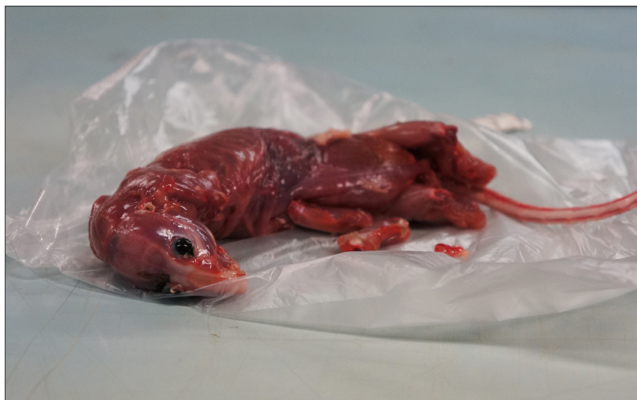
▲ Na de zogeheten bikinisnede wordt de huid van de bruine rat heel voorzichtig losgesneden van de ingewanden. Wat overblijft is de losse huid en het karkas bekleed met spieren, de oogjes nog intact. (Lara de Looze - van Bree)

Met gepaste trots toont Ferry me de geprepareerde rat. Hij is klaar. Opgevuld met kapok, dichtgenaaid en met spelden op een stuk piepschuim vastgepind. Hij schrijft het etiket met een watervaste pen. "Weer een rat," zeg ik. "Daar kun je er nooit genoeg van hebben," antwoordt hij droogjes. Als ik vraag welk dier hij het liefst nog zou prepareren denkt hij even na: "Een wolf. Een Nederlandse wolf." Hij loopt naar het depot om de rat daar te drogen te leggen. Ik loop achter hem aan en kijk nog een keer om naar de tafel waar nog twee mensen in witte jassen met naald en draad in de weer zijn. Het is een macabere hobbyclub, denk ik bij mezelf. Handenarbeid met dierenlijkjes, in naam van de wetenschap. ◀