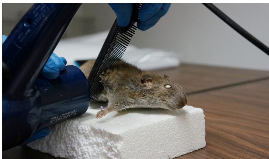
▲ De opgevulde huid wordt gedroogd met een föhn.