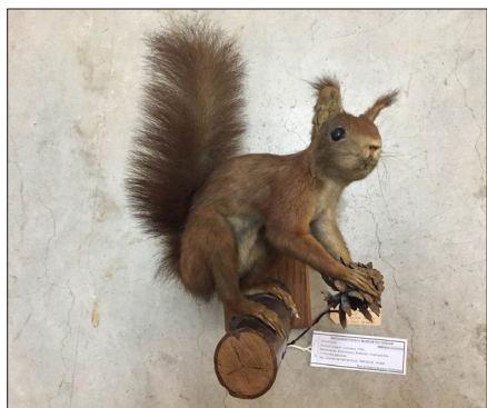
▲ Opgezette eekhoorn, afkomstig uit het Kralingse Bos, 1966; NMR 9990-003310.