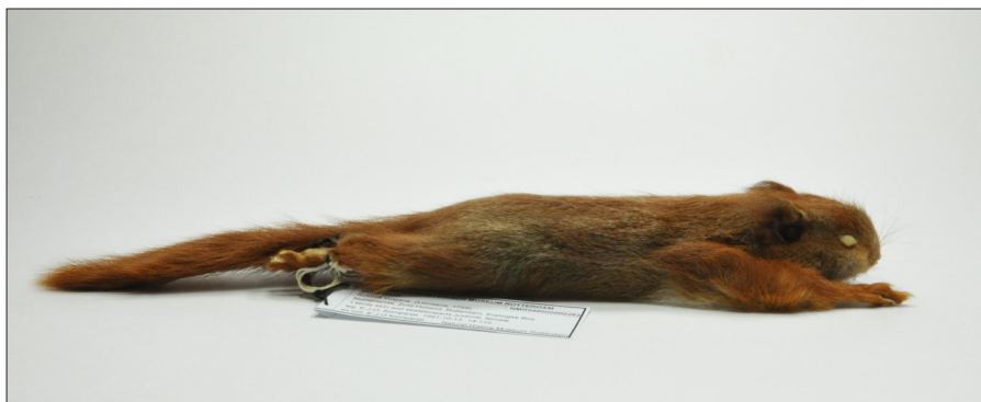
▲ De laatste bewaard gebleven Rotterdamse eekhoorn; Boszoom, 13 oktober 1991; NMR 9990-00282.