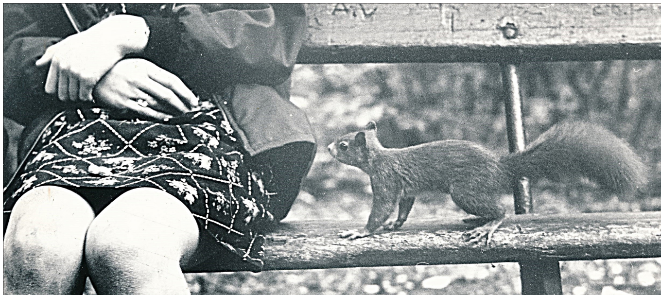
▲ De eekhoorns van het Kralingse Bos waren handtam; augustus 1966.