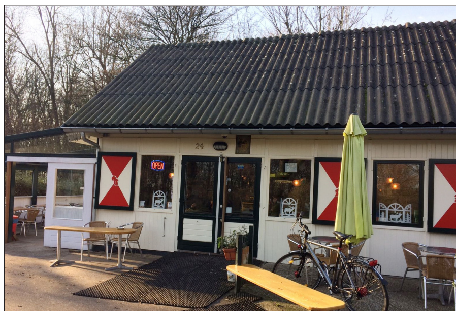
▲ Eethuis de Eekhoorn in het Kralingse Bos; december 2016.