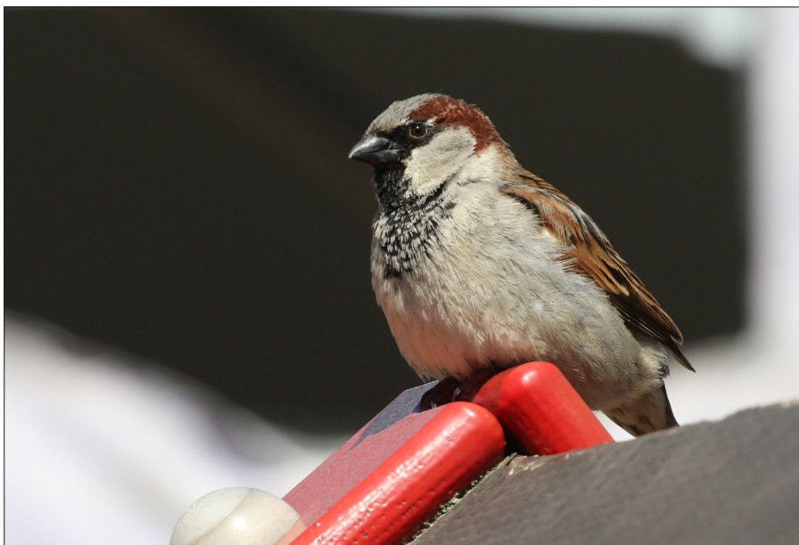
▲ Een huismus in de tuin is allang geen vanzelfsprekendheid meer in Rotterdam.

De klaagzangen van Thijsse en Plomp (en van mijn moeder ten aanzien van haar tuintje in het Rotterdamse Tuindorp Vreewijk) dat in het voorjaar de mussen de uitbottende eerder braaf gepote krokusbolletjes te lijf gingen, zijn thans verjaard. De reden is dat de mussen goeddeels uit de steden en tuinen zijn verdwenen. Hoe en wanneer ging het mis? Naar de omvang van de nationale mussenpopulatie ruwweg een eeuw geleden is het gissen. Maar dankzij de snel groeiende steden met woningen van mindere kwaliteit die mussen een overvloed aan nestplekken boden, moet de mussenbevolking enorm geweest zijn. Veertig jaar geleden kwam Sovon Vogelonderzoek Nederland met een