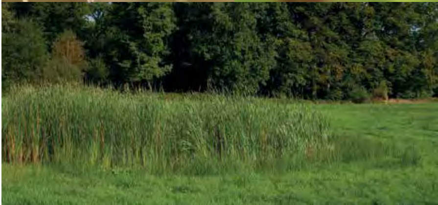
Bruine winterjuffer (linksboven) en tengere pantserjuffer (rechtsboven) zijn enkele kenmerkende libellensoorten van poelen. Onder een poel met lisdodde.