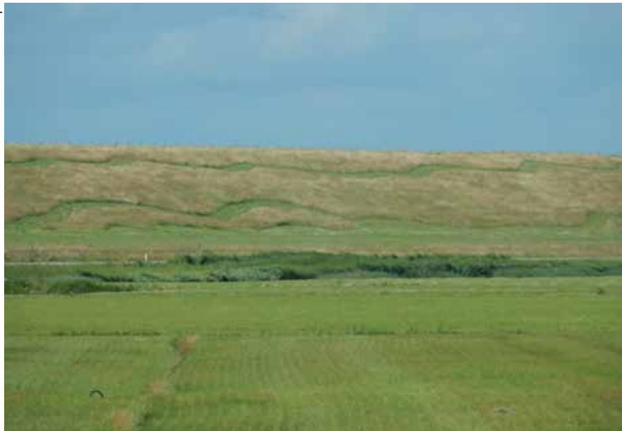
Vanuit de polder is het slingerende sinuspad op de dijk al zichtbaar.