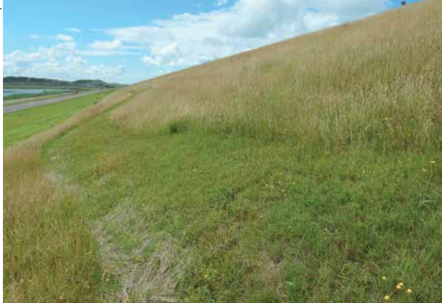
Op het schuine talud van de Hondsbossche Zeewering is een sinuspad maaien geen sinecure, maar de aannemer gaat geen uitdaging uit de weg.

PRINS BERNHARD CULTUURFONDS De kunst van het geven