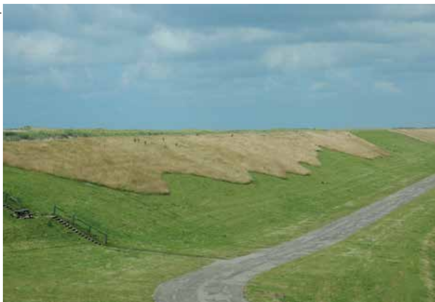
Sinusbeheer inspireert de aannemer om anders te maaien. Geen sinusbeheer avant la lettre, maar er blijft wel veel vegetatie per maaibeurt staan.