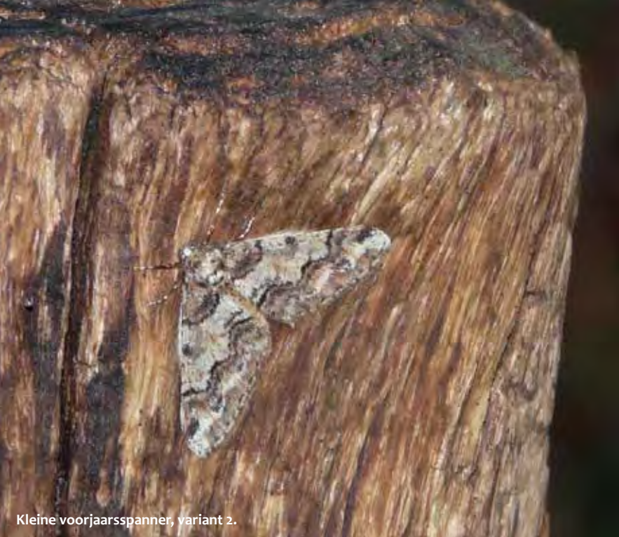
Kleine voorjaarsspanner, variant 2.