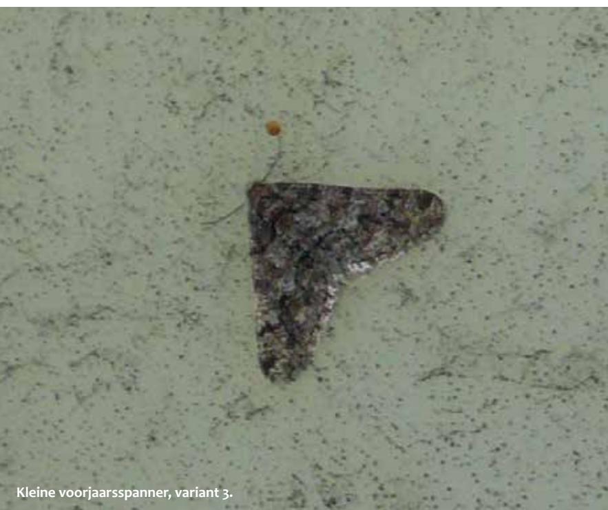
Kleine voorjaarsspanner, variant 3.

in 2010 niet minder gezocht. Helaas zakte na 2012 het aantal waarnemingen erg snel in. Door zachte, vaak natte winters werd het moeilijker om de mannetjes te vinden. Met als dieptepunt 2015, toen helemaal geen kleine voorjaarsspanners werden gezien. In 2016 zijn slechts drie mannetjes gezien; te weinig om in het onderzoek mee te nemen, maar opvallend is het wel. Omdat er in de literatuur weinig staat vermeld over de verschillende forma's, heb ik een steekproef genomen met behulp van waarneming.nl: honderd foto's verspreid over Nederland en de gehele vliegperiode. Al deze exemplaren deelde ik in een van de vijf forma's in. Ondanks dat dit geen enkel hard bewijs levert (vanwege het willekeurige karakter) is het toch verrassend om te zien dat de uitslag van deze steekproef nauwelijks afwijkt van de eerste bevindingen rondom Ede. Pas in 2012 week de uitslag wel sterk af.