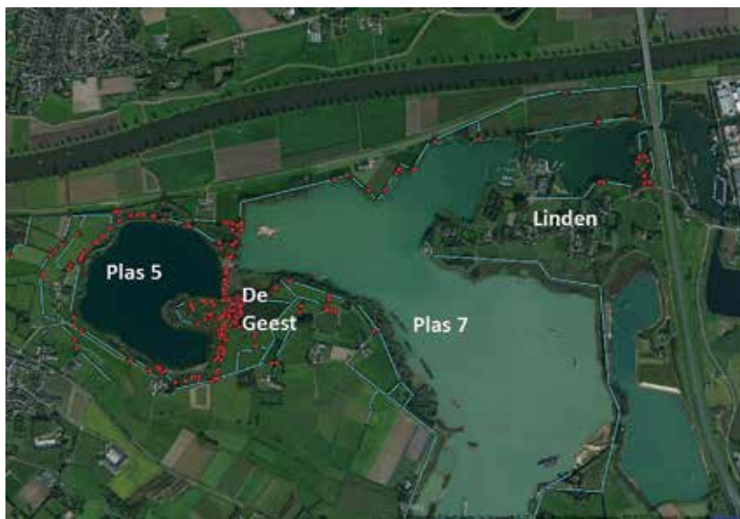
Kaart 3. Vindplaatsen eitjes (rood) en onderzochte stroken zonder eitjes (blauw).

De sleedoornpage is gebaat bij een beheer dat streeft naar de ontwikkeling van mantelvegetaties met een open structuur en geleidelijke overgangen. Sleedoornstruwelen die te oud zijn geworden en weinig jonge uitlopers hebben, moeten gefaseerd worden teruggezet, waarbij de oudste sleedoorns gespaard moeten worden omdat ze in het voorjaar waardevol zijn als nectarplant voor insecten. Waar 'verbraming' optreedt en de sleedoorns gespaard moeten worden, zullen de braamstruiken inclusief wortelstokken rigoureus verwijderd moeten worden. Vaak zal dan ook aanplant van jonge sleedoorns nodig zijn. Het beheerplan 2009-2019 spreekt van het eens in de 10 jaar afzetten van de struweelhagen. Wij zijn ons ervan bewust dat er meer belangen zijn (budget, werkbaarheid, veiligheid) dan het belang van deze mooie vlinder, maar grootschalig en rigoureus klepelen lijkt niet de beste aanpak voor de sleedoornpage. Het afzetten van de sleedoorns zal gefaseerd moeten plaatsvinden waarbij altijd minimaal twee derde van de struiken ongemoeid worden gelaten. Als nectarplanten zijn met name koninginnenkruid en guldenroede van belang. De in het beheerplan genoemde doelstelling om