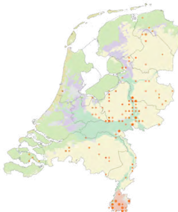
Kaart 1. Verspreiding van de sleedoornpage tot 1950.

Er is nu vastgesteld dat de sleedoornpage de hele noord- en westkant van de plassen heeft bevolkt. Een verrassing was dit voor ons eerlijk gezegd niet. Op de