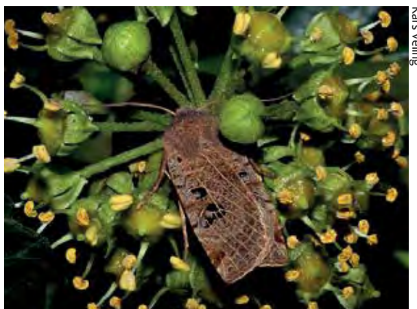
Ook nachtvlinders, zoals deze zwartvlekwinteruil, maken gebruik van klimop.