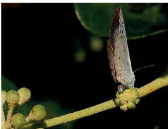
Dit boomblauwtje zet eitjes af op een klimopknop.

Caryopteris of met de grijsbladige lavendel. Ook andere wintergroene heesters zijn interessant voor vlinders. De Amerikaanse sering ( Ceanothus repens ) heeft klein leerachtig blad en mooie blauwe bloemen. Deze heester staat graag op een beschutte plek. Choisya ternata bestaat in een gewone en een smalbladige vorm. Beide bloeien ze met witte bloemen in april en mei. De bloemen geuren heerlijk. Er is ook een variant met lichtgroen blad. Die is vooral mooi in de halfschaduw, want anders wordt het blad erg geel. In de zon trekt deze heester natuurlijk wel meer vlinders aan. Sneeuwbal ( Viburnum tinus ) is een bekende heester die bloeit vanaf oktober tot april. De witroze bloemen geven