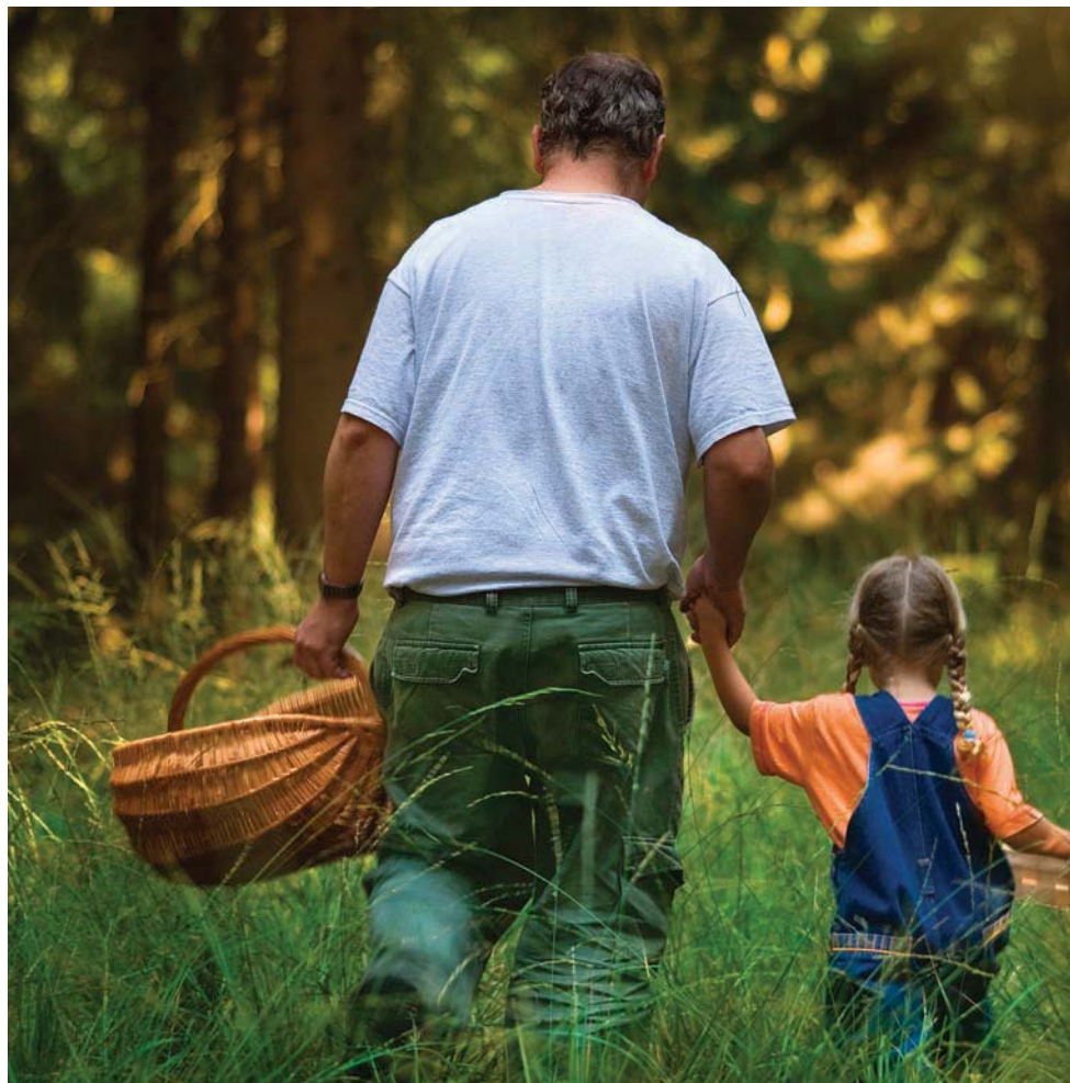
Wildplukken kan niet bij iedereen rekenen op bijval.

De KNNV'ers beseffen dat je door het eten van wilde planten en vruchten een nieuwe groep mensen de liefde voor de natuur kan bijbrengen. Maar dankzij de sociale media kunnen activiteiten die op kleine schaal onschuldig zijn, gemakkelijk uitgroeien tot een hype. In de boekjes kan dan wel staan dat men ‘een klein beetje’ moet nemen en wat ‘voor anderen moet overlaten’, maar stel dat heel veel mensen een klein beetje nemen? Dan is het resultaat van de toegenomen liefde voor de natuur dat de desbetreffende planten in hun voortbestaan worden bedreigd. Dat geldt dan ook voor alle dieren die van deze planten afhankelijk zijn, vlinders, bijen, muizen, eekhoorns en (trek)vogels. In strenge winters komen de