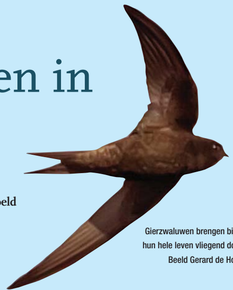
Gierzwaluwen brengen bijna hun hele leven vliegend door.

Gierzwaluwen heb ik altijd al bijzondere vogels gevonden: het zijn echte luchtacrobaten die een intrigerend schel geluid kunnen voortbrengen. Ze komen op mij nogal mysterieus over, omdat ze bijna hun hele leven vliegend doorbrengen. Vandaar dat ik meer over deze vogels te weten wilde komen. Eind april stond ik regelmatig in de tuin, of boven vanuit het slaapkamerraam naar buiten te turen... zie ik ze al?