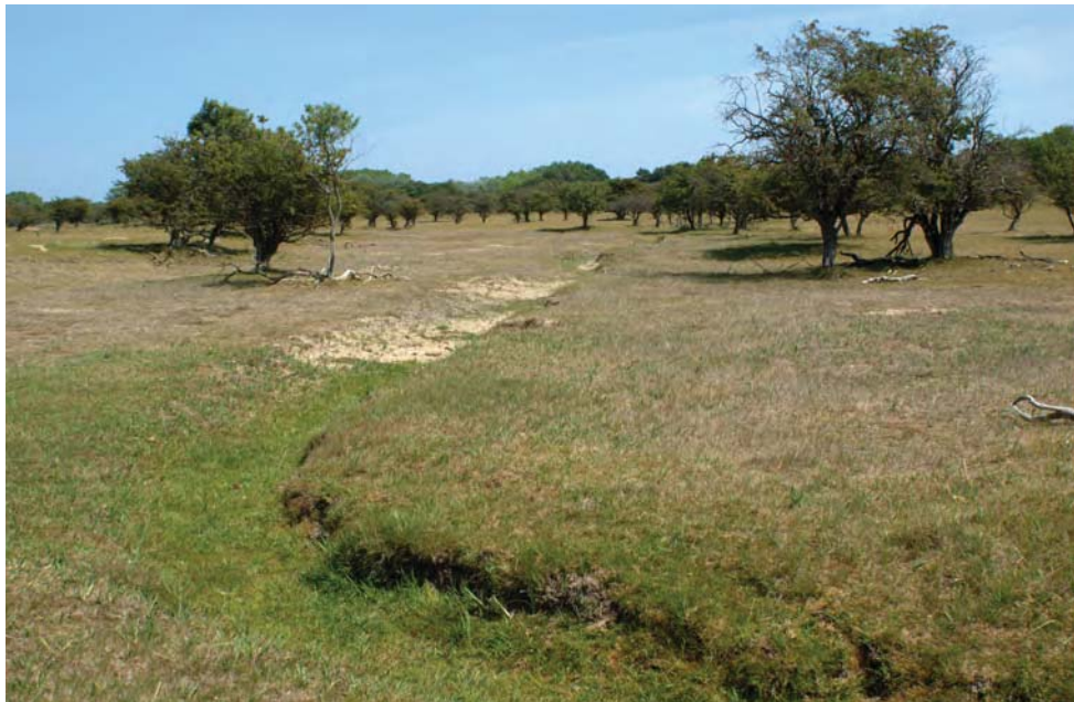
Als een savanne strekt het Palmveld zich uit, met daarin de drooggevalle Beek van het Zegveld.

De velden tussen de binnenduinen en de middenduinstrug staan in het teken van verdroging. Waar onderzoekers 200 jaar geleden moerassen en sappige weilanden aantreffen, kijken we nu op een 's zomers volkomen dorre vlakte met verspreid staande meidoorns en vliegdenen. De Bergen van het Vogelenveld op de achtergrond, hier en daar een troepje damherten of wat koeien versterken het karakter van een savanne. De bodem is diep ontkalkt, maar er zijn ook met kalk en roest verzadigde plekken. In het duingrasland overleven slechts mossen en geharde plantensoorten, vooral de zandzegge met zijn sterk krullende bladen, de soms massaal aanwezige en dan felrood kleurende schapenzuring en de struisgrassen die de velden in een nazomerse witte waas kunnen hullen. Bosjes van kruipwilg en liguster wijzen de weg naar plaatselijke kalkrijkdom. De leemachtige toplaag en de speciale kruidenvegetatie met voorjaarsganzerik, zeegroene zegge, grote tijm, en ruig viooltje zijn typerende veldtekens. De attente landschapslezer zal in de kalk-