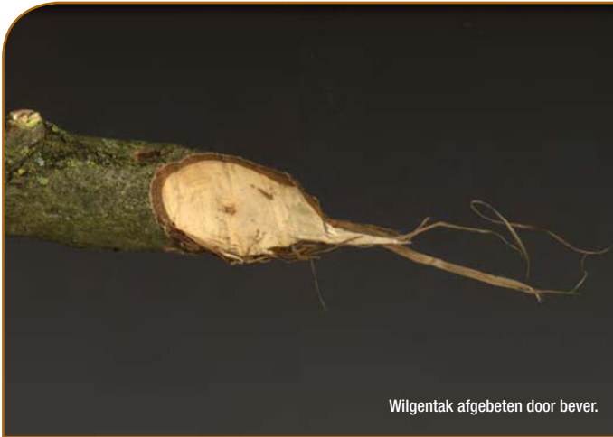
Wilgentak afgebeten door bever.