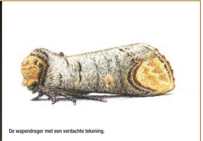
De wapendrager met een verdachte tekening.

Nachtvlinders verstoppelen zich overdag om aan insectenetters te ontkomen. In eindeloze wisselwerking met hun roofvijanden is het uiterlijk van veel nachtvlindersoorten zodanig aangepast, dat ze algemeen voorkomende elementen uit de omgeving nabootsen om minder op te vallen. Dit verschijnsel heet 'mimicry'. Sommige soorten gaan behoorlijk ver in het aanpassen van hun uiterlijk. Zo heeft de wapendrager ( Phalera bucephala ) het nabootsen van een gebroken takje tot een ware kunst verheven!