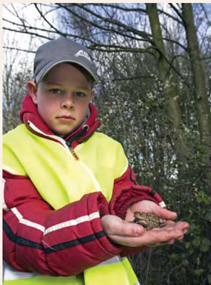
Jeugdige paddenoverzetter.

Het padden overzetten aan de Monnikenweg gaat als volgt in zijn werk: als de temperatuur boven de 5 °C komt, patrouilleren