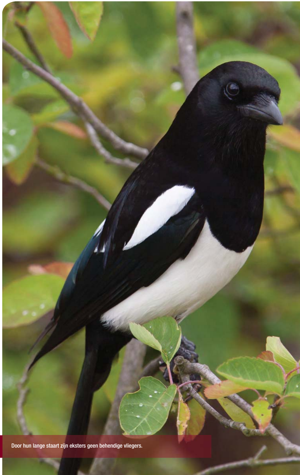
Door hun lange staart zijn eksters geen behendige vliegers.

De meeste andere soorten zangvogels die we in de wijk aantreffen zijn holenbroeders