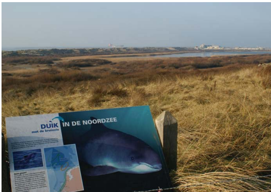
Vochtige duinvalleien en grijze duinen staan centraal op het Kennemerstrand.

In een eeuw tijd is er veel veranderd voor zowel natuur als omgeving. Na verlenging