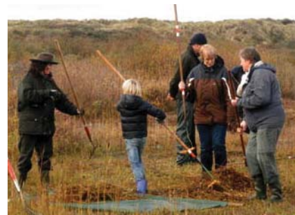
Lekker aan de slag op de Natuurwerkdag 2010.

Al met al draaien de bescherming en het beheer om aanstekelijk enthousiasme, vele