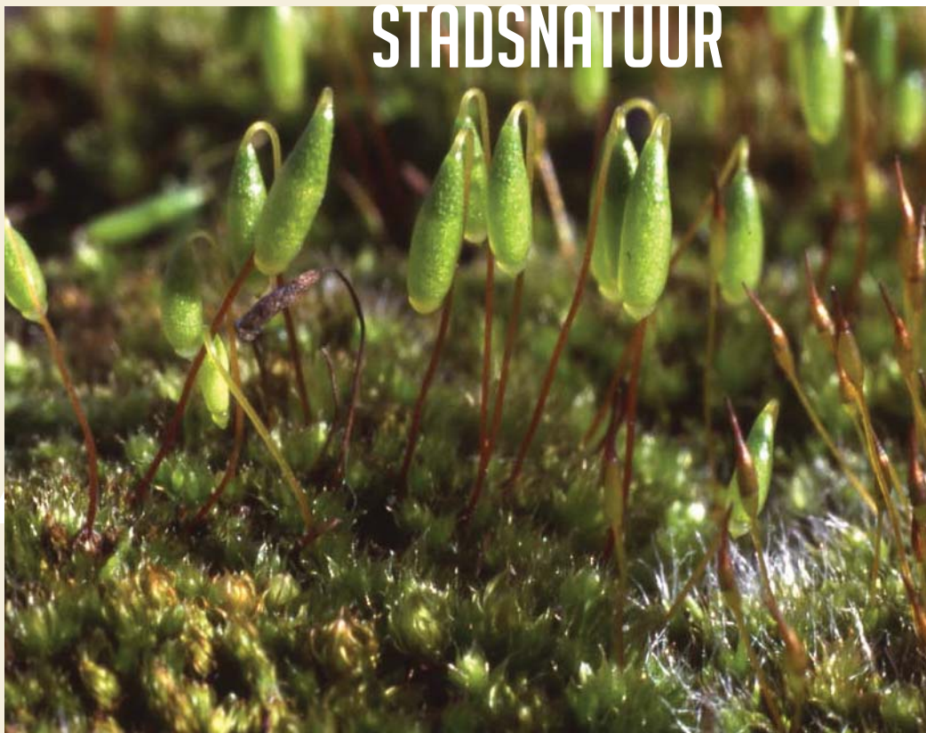
Muurbegroeiing met knikmos (midden) en muurmos (rechtsonder).

Op tuinmuurtjes groeit weer heel ander mos. Haakmos houdt het daar niet uit. Op de muur is het in de zomermaanden veel te heet en te droog. Er groeit wel mos dat zijn 'kopje' er bij laat hangen: het knikmos. Het gedraaid knikmos vormt mooie mosmopjes die nu sporenkapsels dragen. Aan het eind van de kapselsteel knikken ze en daar hangt een groen langwerpige sporendoesje