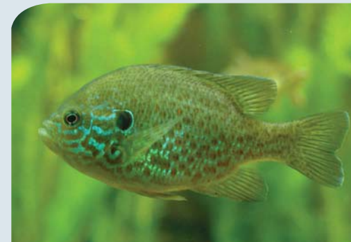
Zonnebaars bedreigt inheemse fauna.