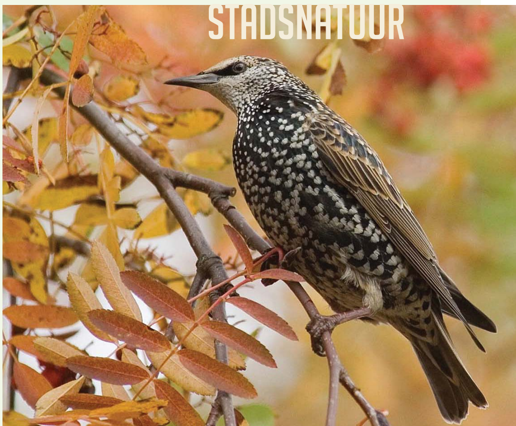
Lijsters houden van bessen.

Het is prachtig als in mei en juni een vlierstruik grote, platte, witte bloemschermen draagt. Nog steeds wordt hij veel aangeplant in tuinen, heggen en plantsoenen. Voor diverse insecten zijn de nectarloze bloemen niet aantrekkelijk. Er is wel stuifmeel, maar slechts enkele dieren helpen mee bij de bestuiving. Als het een beetje waait, wordt het stuifmeel waarschijnlijk ook gewoon van scherm op scherm geschud. Eind augustus en in september zijn de bloemen uitgegroeid tot zwarte vlierbessen. De mens maakt van de vruchten jam of wijn. Merels, spreeuwen en duiven blijven lekker in de buurt van een heerlijk trosje vlierbessen zitten en eten het binnen de kortste keren leeg. De dikke duiven die bij de lekkere hap