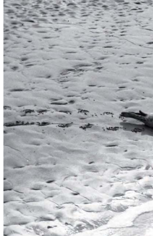
Jonge Zeehond. Beningen, juli 1954.

Als je dan na een tijdje zwarte rookpluimen boven de westelijke horizon zag komen, wist je dat de vloed in aantocht was: de kolengestookte sleepboten met hun slepen