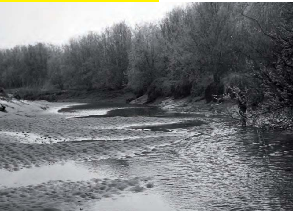
Brabantse Biesbosch, Gat van Vloeien bij laag water, maart 1955.

Maar soms herstelt zich iets: sinds 1993 groeit op één plaats weer Langbladereprijs: in de Louw Simonswaard, iets ten Westen van het rivierduintjesgebied Kop van de Oude Wiel.