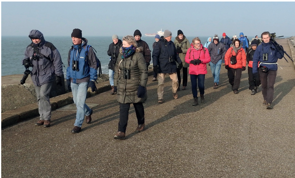
Lekker UITWAAIEN tijdens een excursie op de pier van IJmuiden.