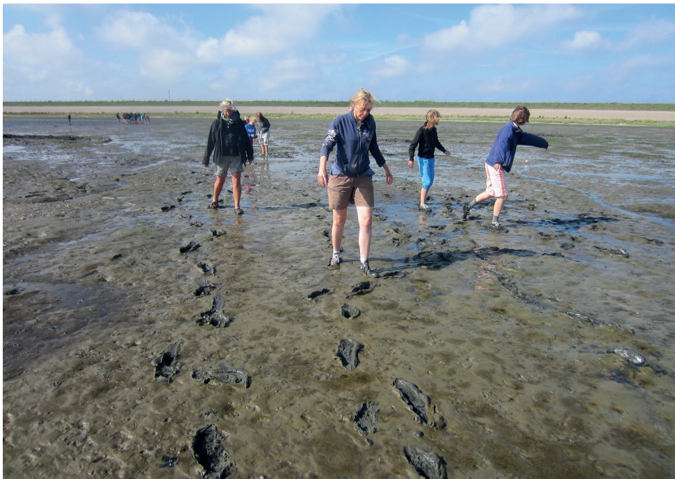
De JEUGDVOGELCLUB zoekt de modder op bij Balgzand.

staan uit minimaal 3 leden en dient de AC, indien nodig, tijdig versterkt te worden.