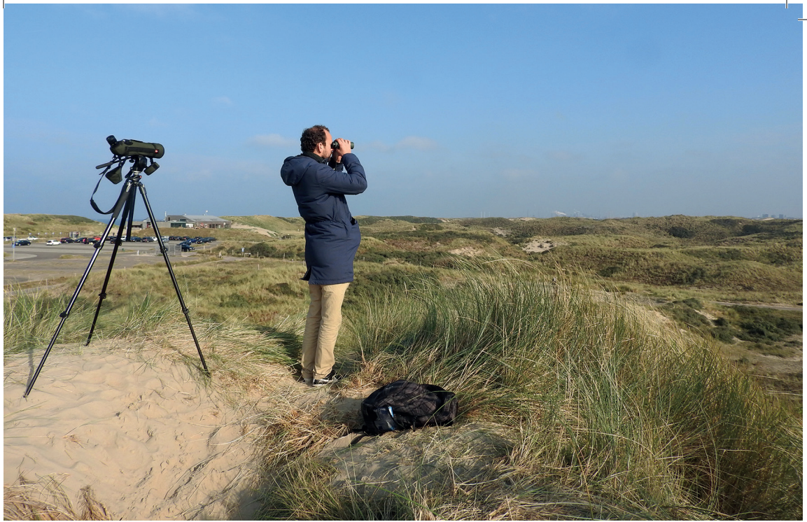
De TELPOST op het duin bij Parnassia voor de landtrek.

De Veldwerkcommissie ziet voor zichzelf de volgende taken: