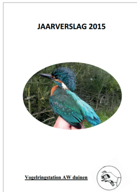
Jaarverslag VOGELRINGSTATION 2015