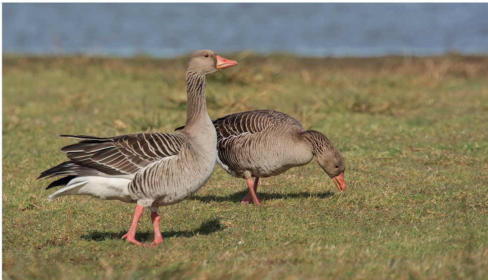
Grazende GRAUWE GANZEN

ganzen heel goed vliegtuigen kunnen en willen ontwijken. Wij denken dan ook dat aanvaringen vooral voor zullen komen tijdens mist of in de schemering. Juist in zulke perioden zou je dus extra maatregelen moeten nemen. Maar die gegevens waren eenvoudig niet beschikbaar. Los daarvan blijft de simpelste maatregel het niet langer beschikbaar stellen van voedsel op en rond de luchthaven. Tot onze verbijstering vernamen we via het evaluatierapport dat zelfs op het terrein van de luchthaven Schiphol tarwe wordt verbouwd. Ook is de afgelopen jaren het gebied waar wintertarwe wordt verbouwd toegenomen. Boeren krijgen premies om na het oogsten de stoppels snel onder te ploegen en die premie plus de opbrengst van de tarwe is blijkbaar aantrekkelijk genoeg om op nog meer percelen wintertarwe te verbouwen. Tja, dan willen die ganzen ook wel een hapje mee-eten. Door dit soort zaken ontging het ons volledig, waar de conclusie op was gebaseerd om de kritische zone rond Schiphol uit te breiden tot 20 kilometer. Wij hebben nu al grote vraagtekens bij het doden en afschieten van vele tienduizenden ganzen in de 10 kilometerzone. Het heeft er verdacht veel van weg dat andere dan luchtvaartbelangen mede debet zijn aan het huidige pief-paf-poef beleid.