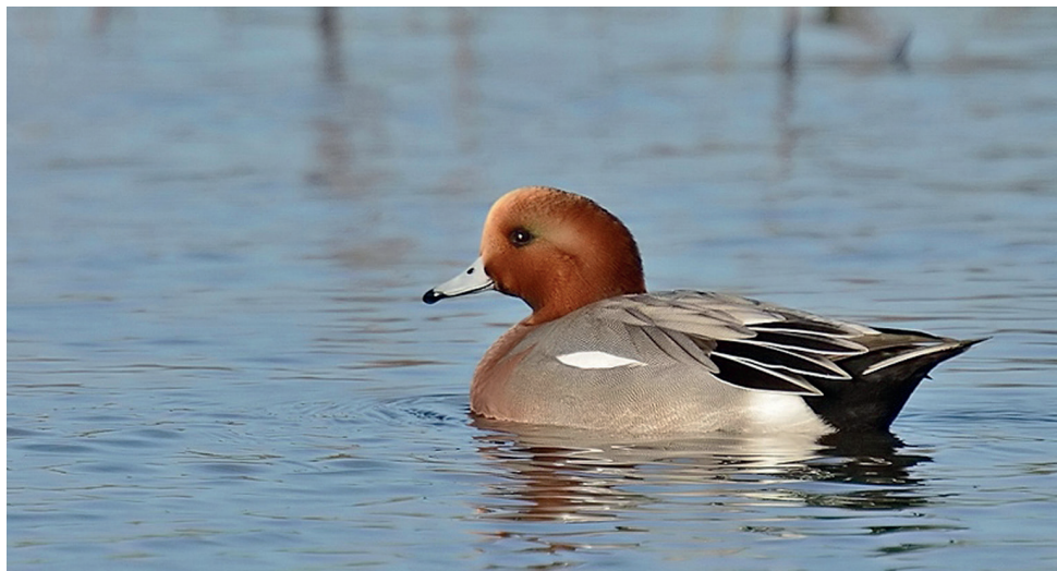
SMIENT