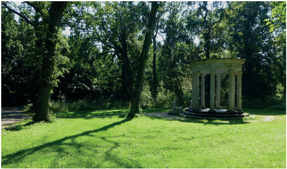
Het VOORBOS van Eindhovenout met het koepeltje.

steed. Vanuit de Adviescommissie zijn toen concrete voorstellen ingebracht om dat hiaat te dichten. Omdat het anders niet wilde lukken hebben de groene vertegenwoordigers in de commissie uiteindelijk zelf de tekenpen ter hand genomen om duidelijk te maken wat hen voor ogen stond. Uiteindelijk pakte de gemeente deze ideeën dankbaar op. Nu ligt er een plan waar iedereen achter kan staan. Voor de gemeente een pluim, omdat ze ook geld heeft weten vrij te maken voor het herstel van de Heemtuin. Een leuk detail uit de plannen: er komt ook een ijsvogelwand langs de sloot tussen Vogelbos en Heemtuin, op een plek waar zich dit jaar al een ijsvogelpaar enkele weken lang heeft laten zien. Met grote inzet wordt eraan gewerkt om de werkzaamheden nog dit najaar tot uitvoering te brengen.