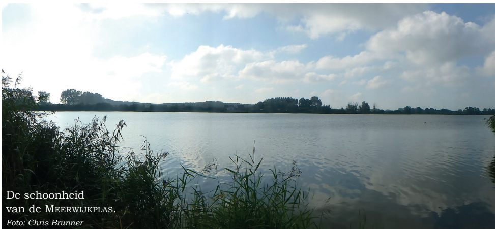
De schoonheid van de MEERWIJKPLAS.

Het uitgevoerde onderzoek bevestigt nu wat wij en andere betrokkenen al vreesden. De natuur in en om de plas zou flink te lijden hebben als het waterpeil om de 5 jaar