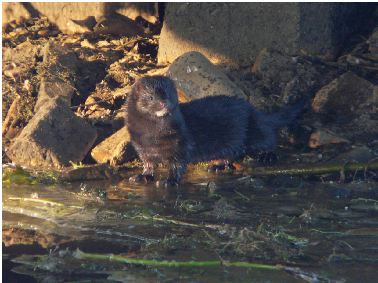
Amerikaanse nerts.

Dekker, J.J.A., 2012. De Amerikaanse nerts in Nederland. Rapport 2012.16. Zoogdiervereniging, Nijmegen