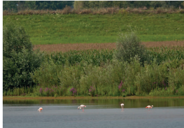
Chileense en Europese flamingo's in een Nederlandse setting.

De eerste gedocumenteerde waarneming van een flamingo in Nederland, betrof een Europese, en deze dateert van 1906. Lange tijd waren flamingo's een onregelmatige verschijning in het wild, maar sinds het begin van de jaren zeventig worden er in toenemende mate flamingo's in Nederland waargenomen. In eerste instantie betrof het Chileense en later - in ieder geval vanaf de jaren tachtig - ook Europese flamingo's. Recent gaat het vermoedelijk om