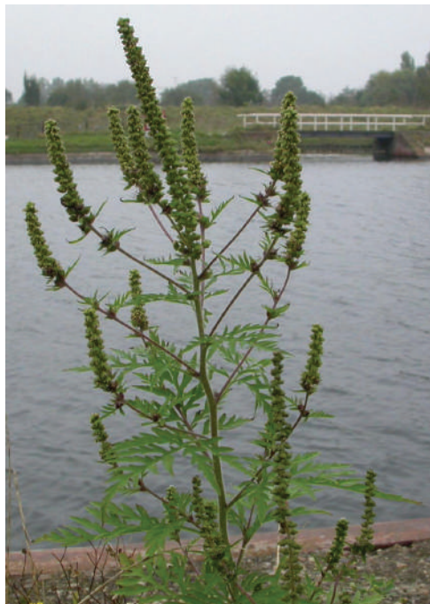
Alsemambrosia langs de waterkant.

Het probleem met ambrosia is niet zozeer dat het andere planten of dieren verdringt, maar zit in de gezondheidsrisico's. Het is een beruchte plant als het gaat om hooikoorts. Mensen kunnen heel allergisch zijn voor het stuifmeel (pollen), net als dat van grassen en sommige bomen. Bovendien bloeit ambrosia in de maanden augustus tot oktober, wanneer de meeste andere hooikoortsplanten uitgebloeid zijn. Met name in Zuid-Europa zijn veel mensen die in die periode gezondheidsklachten hebben. In Nederland probeert de NVWA met een aantal partners te voorkomen dat we ook in zo'n situatie belanden.