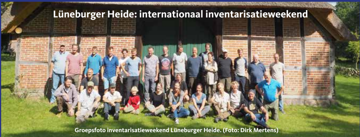
Groepsfoto inventarisatieweekend Lüneburger Heide.

Een mooi voorbeeld van een activiteit die voor de RAVON-vrijwilligers is georganiseerd en hoog werd gewaardeerd, is het inventarisatieweekend naar de Lüneburger Heide (Duitsland).