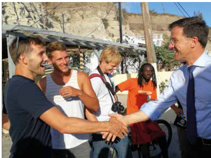
Premier Rutte was zeer geïnteresseerd in het onderzoek en de bescherming van de Antilliaanse leguaan, en verheugd daaraan op deze wijze een bijdrage te kunnen leveren door de vier Antilliaanse leguanen veilig mee te nemen naar Nederland.

Nadat we twee vrouwtjes en één mannetje hadden gevangen, lukte het ons maar niet om een geschikte tweede man te vinden. En het moment van vertrek naderde. Totdat we 's morgens vroeg het tijdelijke opvangverblijf van de leguanen in de botanische tuin van Statia