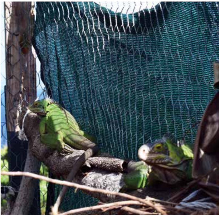
Twee van de vier gevangen Antilliaanse leguanen in hun tijdelijke opvangverblijf in de botanische tuin op Statia, vlak voor het transport naar Nederland.

Najaar 2017 leek het eindelijk zo ver. Een medewerker van RAVON en Blijdorp zouden naar St. Eustatius gaan om de leguanen te vangen en op te halen. Maar de orkanen Irma en Maria gooiden roet in het eten.